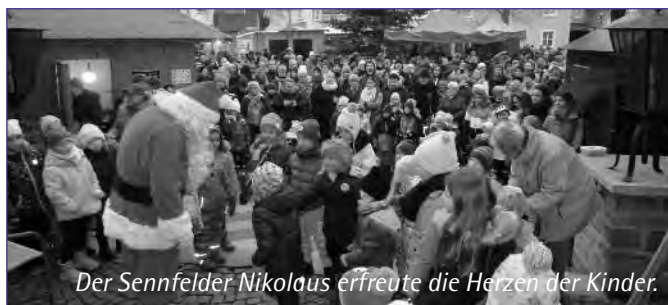
Der Sennfelder Nikolaus erfreute die Herzen der Kinder.